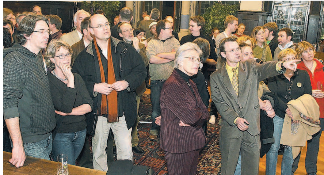
Die Spannung war groß, als im Sitzungssaal des Rathauses die Einzel-Ergebnisse der Stadtratswahl einliefen und sofort auf der Leinwand gezeigt wurde. Das Ergebnis würfelte das Ratsgremium komplett durcheinander.